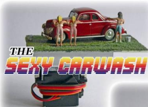
THE SEXY CARWASH

Einmalaufgabe NOCH, nur solange Vorrat reicht!